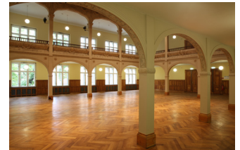
Villa Elisabeth, Saal mit Galerie 1./2. OG