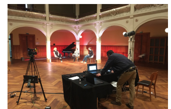
Setting mit Übertragungstechnik

Kultur Büro Elisabeth gGmbH Invalidenstr. 4a, 10115 Berlin Kontakt: info@elisabeth.berlin / Tel. 030 - 44043644, kultur@elisabeth.berlin / Tel. 94047669 und vermietung@elisabeth.berlin / Tel. 44043918 oder 55239374