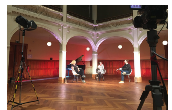
Gesprächssetting im Galeriesaal