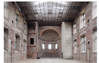
St. Elisabeth, Blickrichtung Apsis