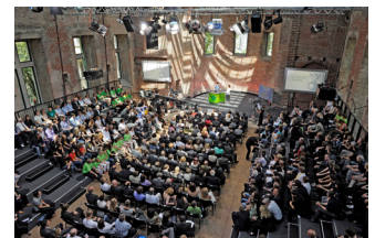
Preisverleihung durch Angela Merkel