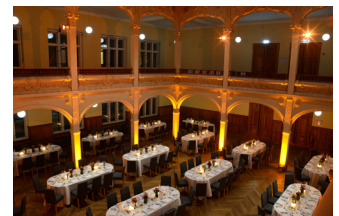
Villa Elisabeth, Aufbau für Dinner im Saal