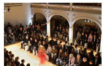
Modenschau in der Villa Elisabeth