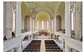
Blickrichtung zur Apsis mit Empore EG/1. OG: 600 + 450m 2