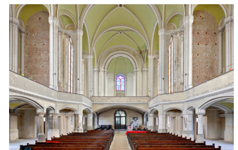
Blickrichtung zum Eingang, EG: 600 m 2