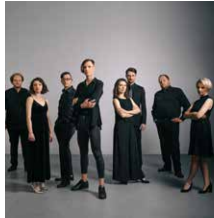
Spółdzielnia Muzyczna

Mit freundlicher Unterstützung der Ernst von Siemens Musikstiftung