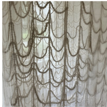
Installation von April Camlin im Wärterhaus des LISBETH

Fr, 8. Aug. / 5. Sept. / 26. Sept. 16-18 Uhr: Von der Seele reden – Ein offenes Ohr für Trauernde