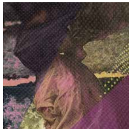
SonusFeminæ #8 Grafik © Miako Klein

Do, 30.04. bis 03.05., ahorn Space: Trauerritual für Übergangszeiten mit Trauerbegleiter*in Pauli