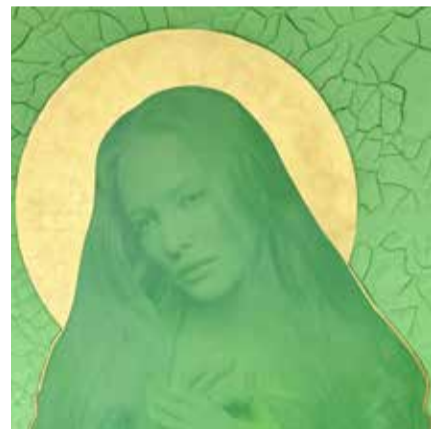
Cate Blanchett 3, 2026