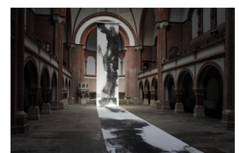
Bingyi: Die Gestalt des Windes, 2012