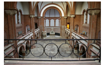
Blick von der Empore