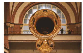
Sabrina Hölzer: Six Bells, 2016